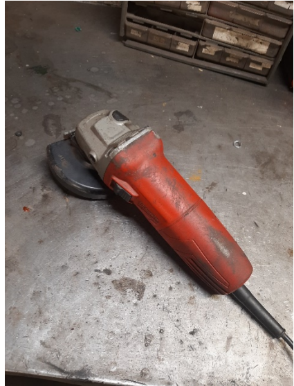
Kuva 8 Milwaukee hinta noin 75€

Matrix räälläkstä ei ole kuvaa, mutta hinta oli noin 30€