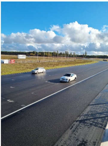
Kuva 10 Subaru ohittamassa

Kerho järjesti perinteisesti kahdet ratapäivät. Heinäkuussa Ahvenistolla ja lokakuussa Alastarolla.