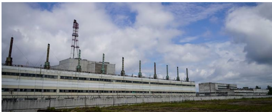
Kuva 11 Ignalis

Osa kerholaisista kävi tutustumassa Liettuan isoimpaan betonikuutioon. Kuutio oli iso ja harmaa.