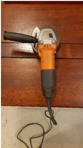
Kuva 6 AEG hinta noin 65€