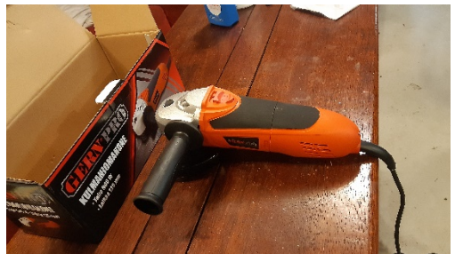
Kuva 5 Gerni hinta noin 30€