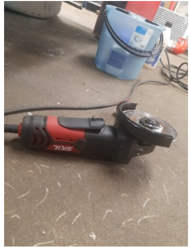
Kuva 3 Skil hinta noin 35€