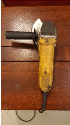
Kuva 4 Dewalt hinta noin 75€