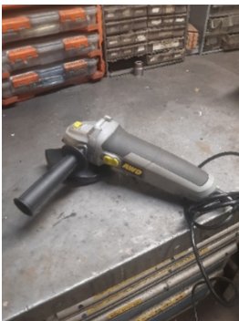
Kuva 1 AWD hinta noin 35€

Testissä mukana olleet rälläkkät ovat kaikki pieniä noin 800 wattisia koneita. Lähtökohtaisesti rälläköitä on ollut yksi per merkki, joten otanta on pieni. Alla esiteltä testissä olleet koneet.