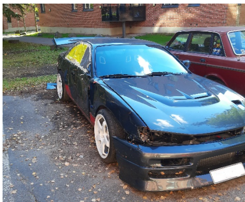
Kuva 9 Onko tylsää ja kaipaat tekemistä. Ratapäivillä on helppo järjestää itsellensä tekemistä pitkäksi aikaa