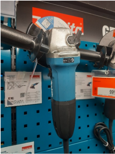
Kuva 7 Makita hinta noin 90€

Matrix räälläkstä ei ole kuvaa, mutta hinta oli noin 30€