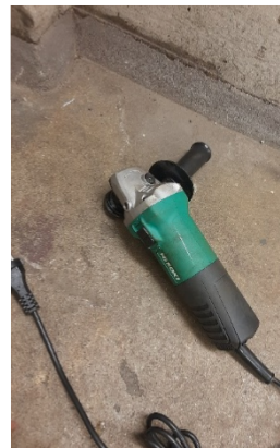
Kuva 2 Hikoki hinta noin 35€