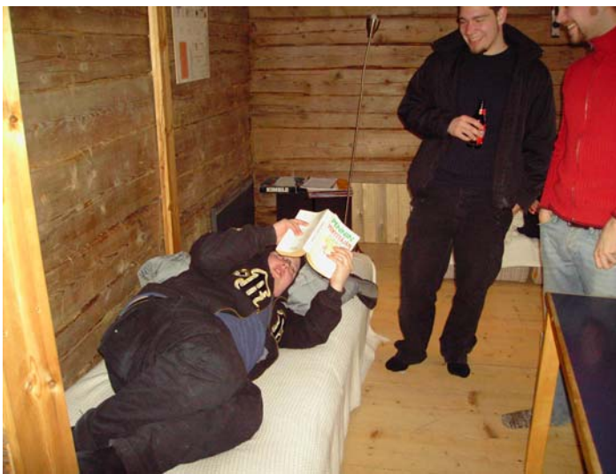
Matti lukee, muut kuuntelevat

Järjestettiin luonnon helmassa, AK:n majalla, kuten viimevuonnakin. Henkilökohtaisesti meinasi lähtö hieman viivästyä, johtuen edellisen päivän/yön käyttämisestä hankirallissa, päivän venyessä aamuyön tunneille. Tarpeelliset unet nukuttua oli aika heräämisen, ja tallille siirtymisen, josta jo kiireisemmät olivat matkaan lähteneet. Kun auto oli saatu pakattua ja halukkaat kyytiin, oli lähdön aika. Perille saavuimme kuitenkin huomattavasti aikaisemmin kuin toinen autokunta, heistä oli mukavampi eksyä matkalle, ja jättää meidät odottamaan pakkaseen. Emme kuitenkaan jääneet heitä kyräilemään, koska lopulta pääsimme sentään kaikki viettämään hauskaa iltaa.