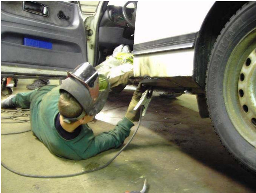
Saabin elvytystä tallilla ala Turku